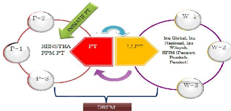
Gambar 1.1 Alur Penyusunan Renstra Pengabdian Masyarakat PT

Berdasarkan bahan pertimbangan sebagaimana dikemukakan diatas, maka Rencana Strategis (Renstra) Pengabdian Masyarakat Universitas Al Asyariah Mandar ini disusun dengan alur seperti pada gambar 1.1