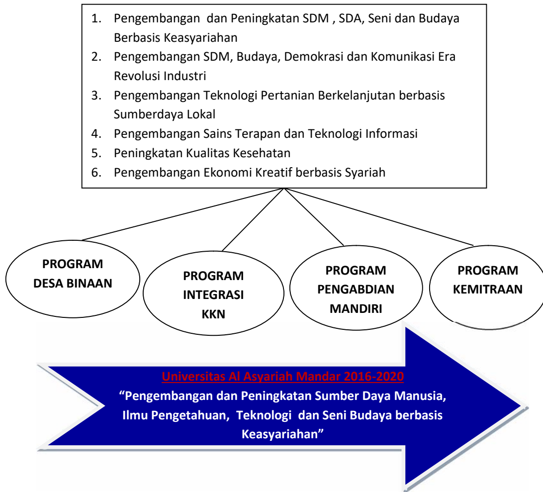
Gambar 4.1. Tema Unggulan Pengabdian Masyarakat Universitas Al Asyariah Mandar 2020-2024

Tema dan program Unggulan pengabdian masyarakat sebagaimana dikemukakan di atas, merupakan cerminan dari hasil perumusan masalah-masalah di masyarakat, sehingga selanjutnya menjadi fokus perhatian dosen-dosen peneliti di Universitas Al Asyariah Mandar. Identifikasi permasalahan menurut masing- masing bidang diperlukan sebagai fokus strategi penyelesaian masalah serta pengalokasian pendanaan. Menimbang Universitas Al Asyariah Mandar, masih sangat terbatas dalam hal kualifikasi dosen serta sarana dan prasarana, maka alokasi dana pengabdian masyarakat berdasarkan Program Hibah Pengabdian Masyarakat dan program-program pemerintah daerah